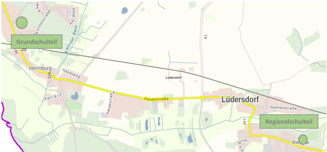
Abbildung 2: Standorte der Regionalen Schule mit Grundschule Lüdersdorf