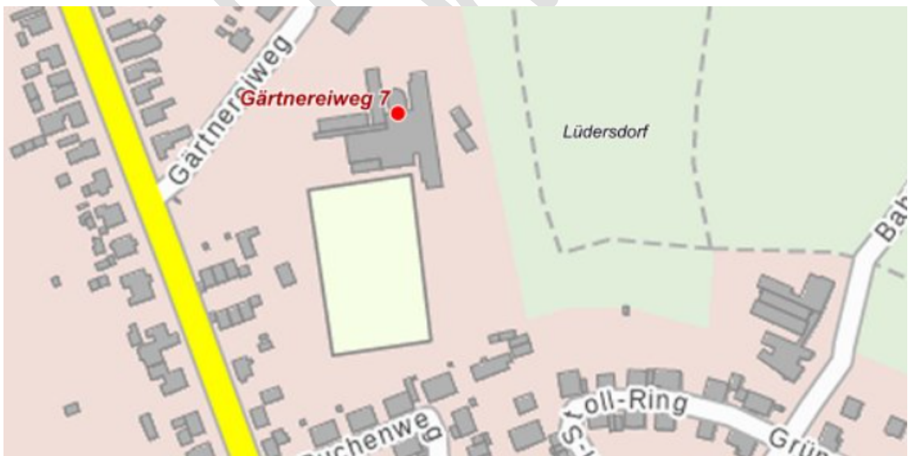
Abbildung 3: Standort Grundschulteil der Schule Lüdersdorf