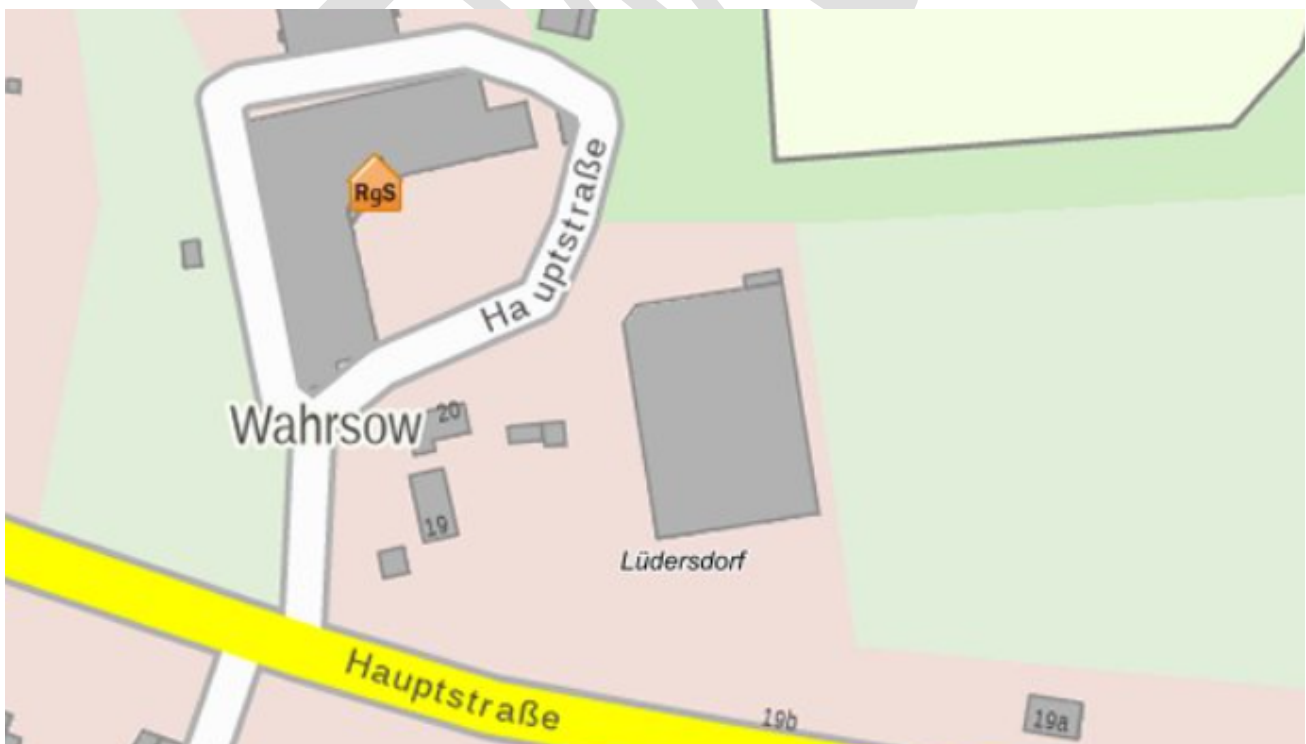
Abbildung 4: Standort Regionalschulteil der Schule Lüdersdorf