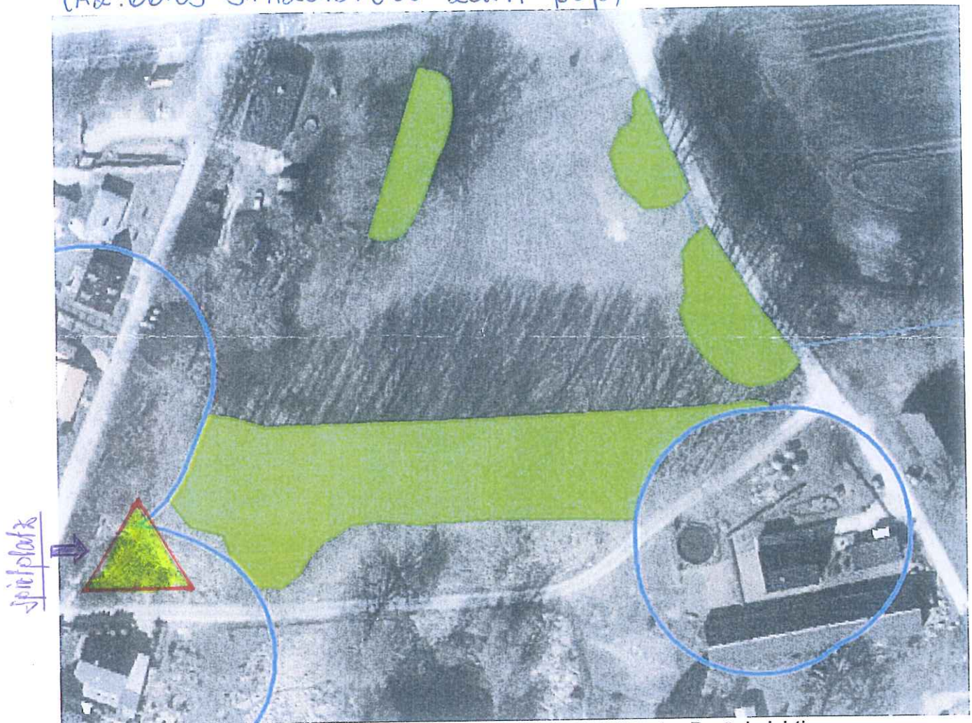
Abbildung 2: Lage der Pflanzfläche auf dem Flurstück 130/4 unter Berücksichtigung Waldabstand 30m

Anlage zum Bescheid vom 08.01.2015 (AZ: 66.03-311/2015/Öko-Zarn-pap)